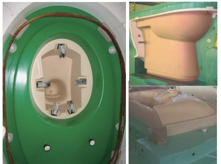
陶瓷母模表面无任何瑕疵

表面无收缩痕 浅杏色更易于察觉产品瑕疵 耐脱模剂化学腐蚀性强 易于表面磨砂处理 可操作时间长，操作简单 耐潮性能好